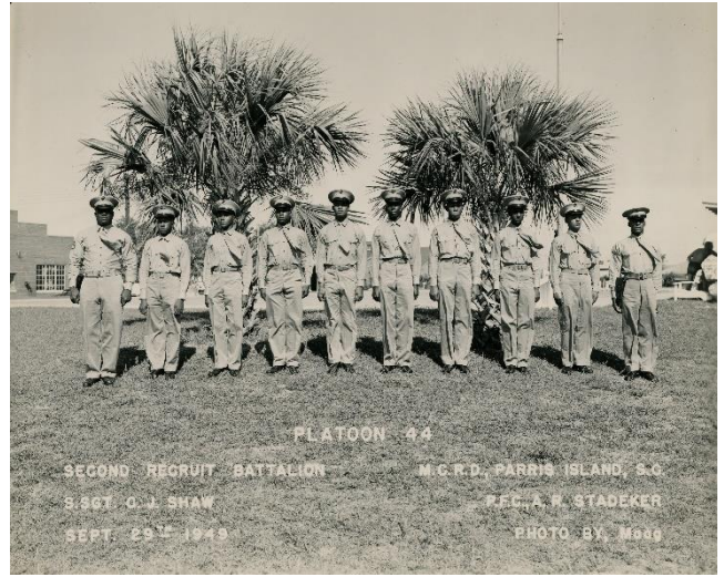
1949 年，查爾斯與 44 排南卡羅來納州帕里斯島海軍陸戰隊訓練營

1953 年，查爾斯被調往南加州聖地亞哥的彭德頓海軍陸戰隊訓練營 (Camp Pendleton)，並把家搬到了聖塔安娜市。